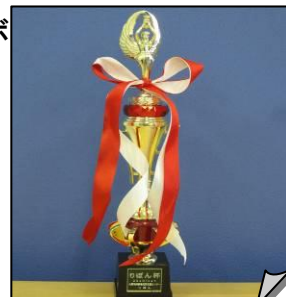
りぼん杯のトロフィー