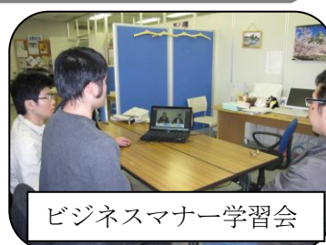
ビジネスマナー学習会