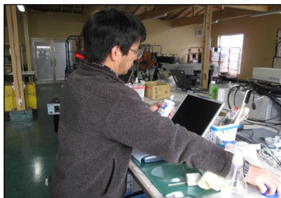
Cさん：青い手帳 平成23年5月～ パソコンリユース大切です