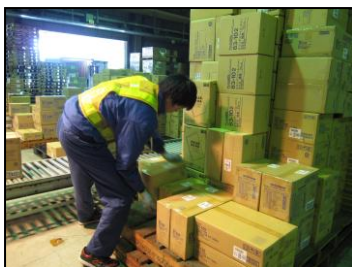
Aさん：緑の手帳 平成23年3月～ 物流、力仕事でも平気だい